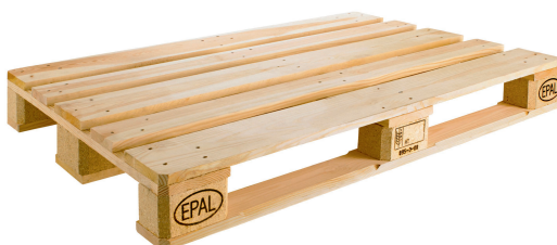
Standardpaletten gehören zum Hauptgeschäft von Madera.