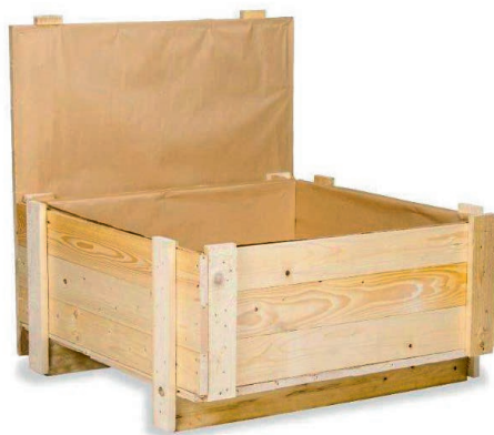
Systemverpackung: klassische Holzkiste mit Karton ausgelegt.