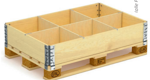
Klapprahmen mit mobilen Zwischenwänden.